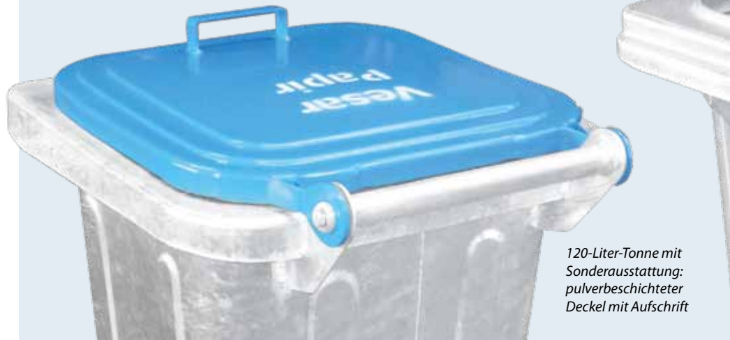
120-Liter-Tonne mit Sonderausstattung: pulverbeschichteter Deckel mit Aufschrift

Stahl werden nur hochwertige Bleche verwendet. Alle Behälter werden ausschließlich mit galvanisch verzinkten Stahlachsen aus Vollmaterial ausgestattet, schlagfest und korrosionsbeständig. Der Behälter ist mit einem laufruhigen Vollgummireifen bestückt, welcher einer Zertifizierung gemäß DIN EN 840 unterliegt. Die Radbefestigung erfolgt durch einen federbelasteten Stahlstift, der in eine Nut an der Achse einrastet. Durch die am Behälter angebrachte Verriegelungsleiste ist eine sichere Aufnahme des Behälters gegeben und eine gängige Schüttung zur Entleerung möglich.